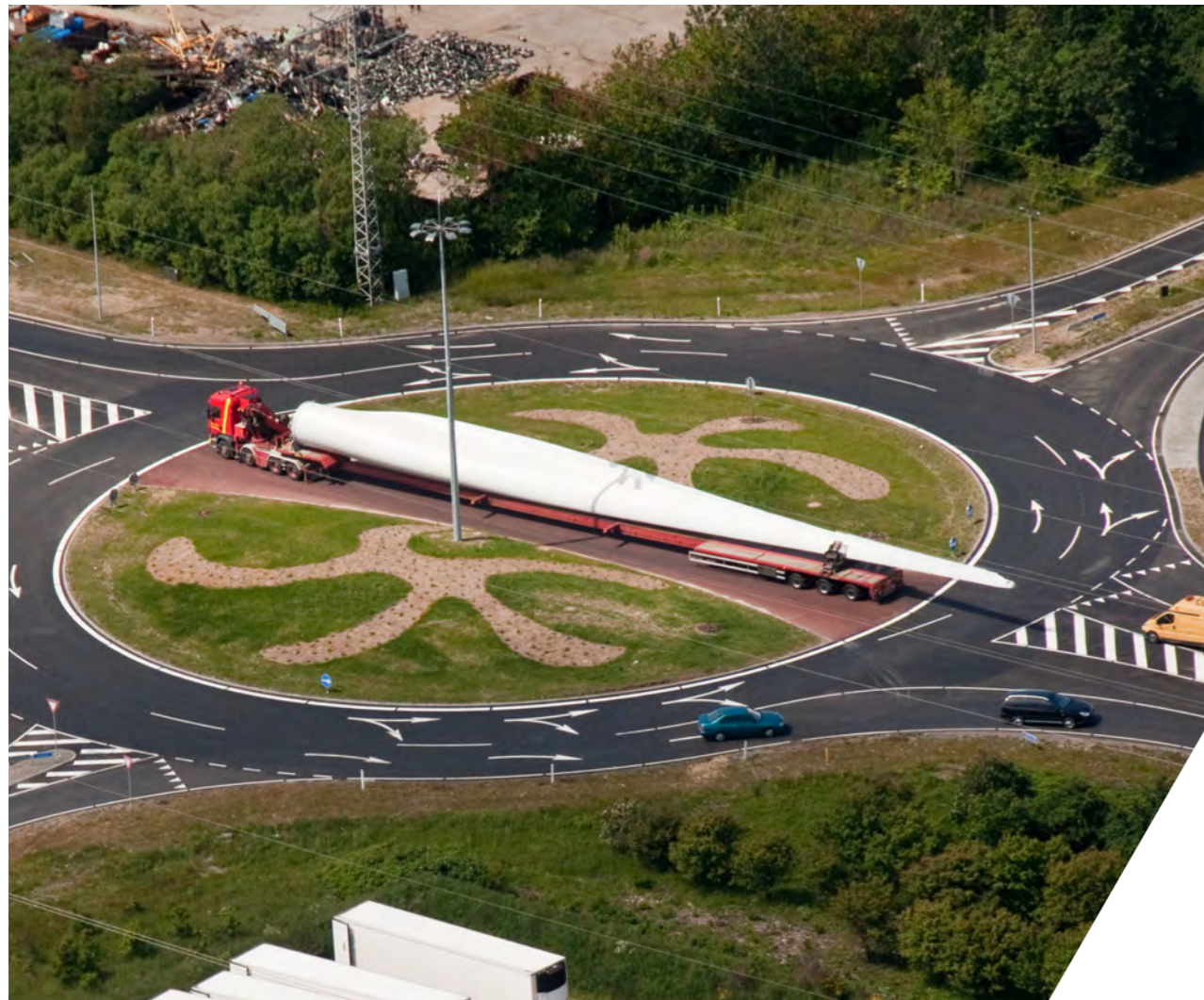
Rundkørslen ved Jernevej er udvidet til dobbelt størrelse - nu som to-sporet rundkørsel. Alle tre rundkørsler på strækningen er designet, så de lange særtransporter nemt kan komme igennem uden at genere trafikken.

Esbjerg Havn er i gang med en større udbygning af havnen, og den nye vej sikrer en tilstrækkelig fremkommelighed i trafikken, når havnen er fuldt udbygget.